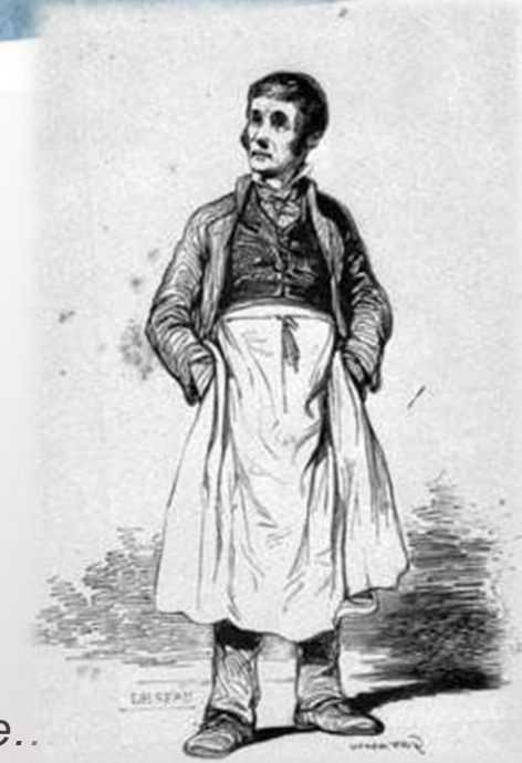
Infirmier en 1840, extrait encyclopédie morale du XIXe S