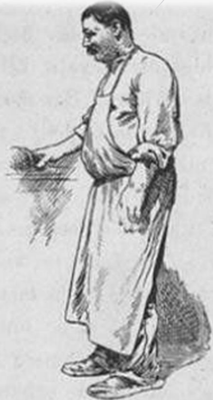
FIG. 41. — Infirmier en chirurgie dessiné sur le vif en 1900 dans un de nos hôpitaux parisiens; la figure seule est modifiée.